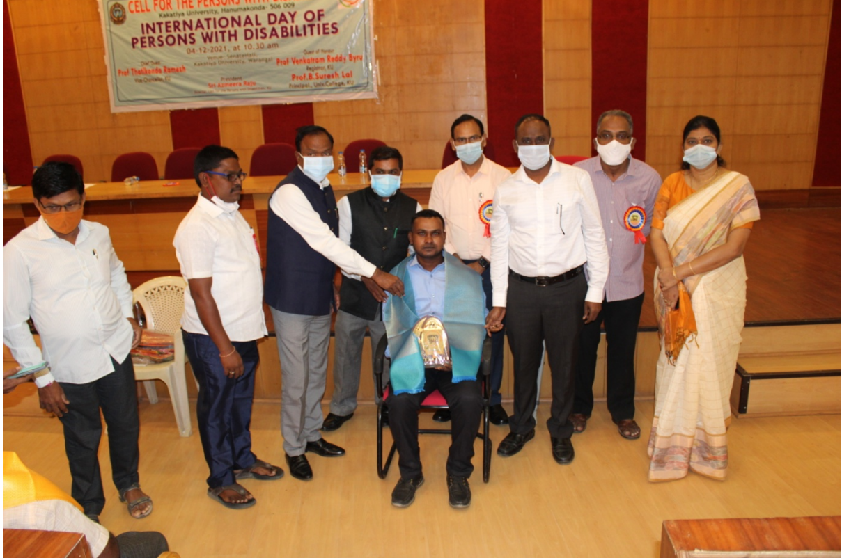
Felicitation to Differently-abled Students who completed Ph.D