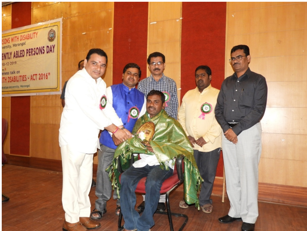
Felicitations to Differently-abled Students who completed Ph.D