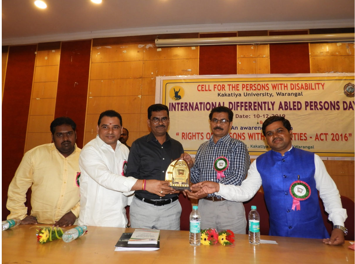
Token of Appreciation by Registrar, Cell Director and Others