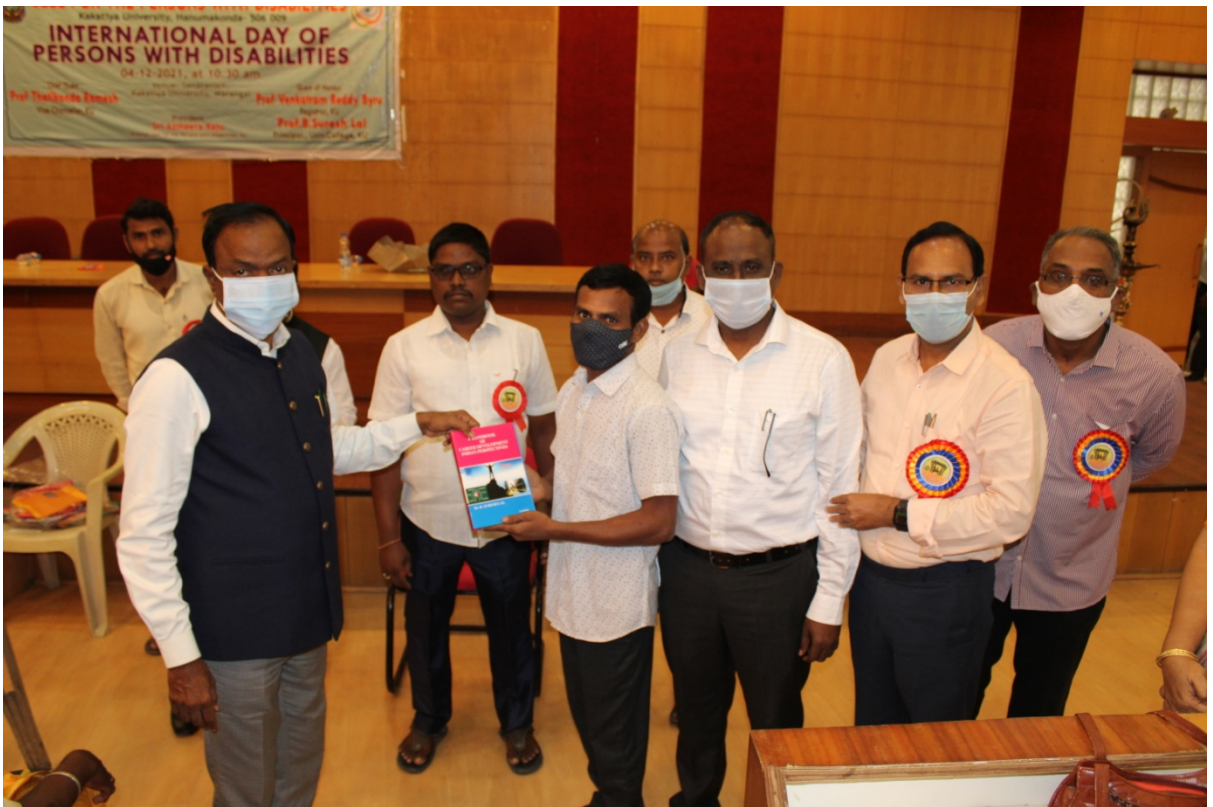
Gifts presenting by hon'ble V.C-KU