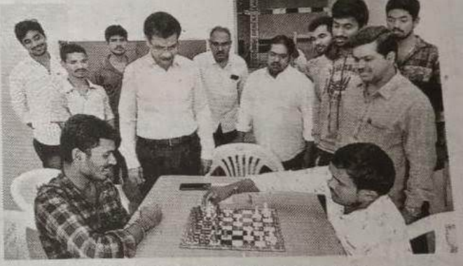
చదరంగం ఆడుతున్న విద్యార్థులు