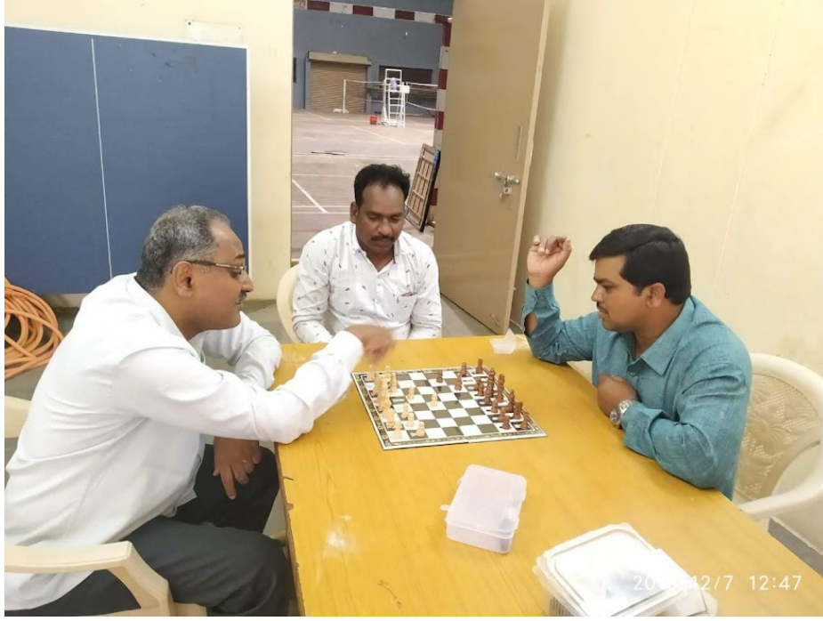
Games For Differently -Able Teachers