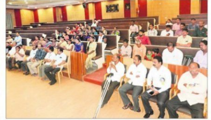
సమావేశంలో పాల్గొన్న విద్యార్థులు