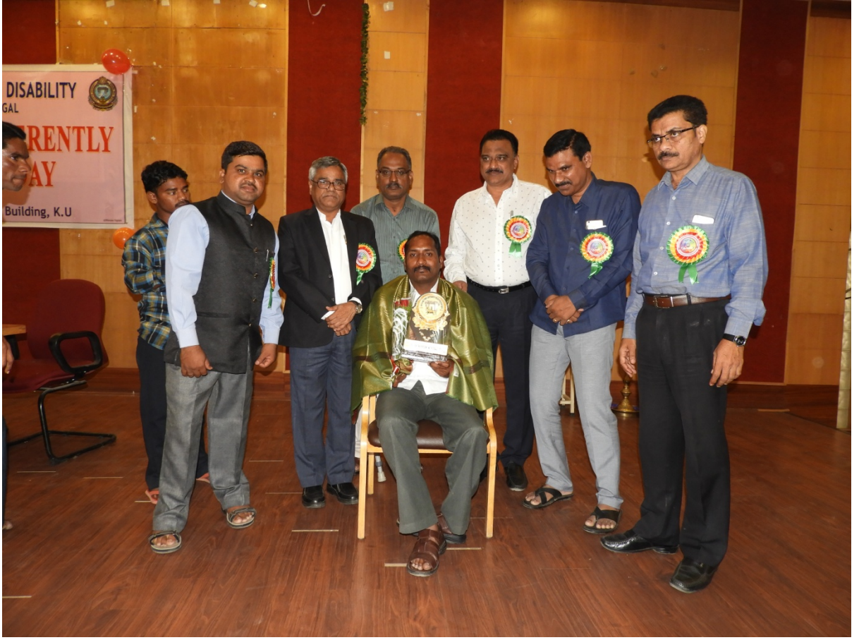
Felicitation to Differently-abled Students who completed Ph.D