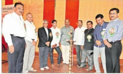
జ్యోతి ప్రజ్వలన చేస్తున్న వీసీ సాయన్న

కేయా క్యాంపస్: దివ్యాంగులు నూతన సాంకేతిక పరిజ్ఞానాన్ని వినియోగించుకోవాలని, యూనివర్సిటీలోని దివ్యాంగులకు అవసరమైన సదుపాయాలను కల్పిస్తామని వీసీ ఆచార్య సాయన్న అన్నారు. యూనివర్సిటీ దివ్యాంగుల సెల్ ఆధ్వర్యంలో మంగళవారం కేయా సెనెట్ హాల్లో నిర్వహించిన ప్రపంచ దివ్యాంగుల దినోత్సవంలో ఆయన ముఖ్యఅతిథిగా పాల్గొని మాట్లాడారు. దివ్యాంగుల సాధికారత సాధించినప్పుడు మాత్రమే ముందుకు పోగలుగుతారన్నారు. దివ్యాంగులకు సంబంధించిన వివిధ హక్కులు, వధికాలు గురించి వారికి అవగాహన కల్పించాలన్నారు. పరిశోధకులు దివ్యాంగులకు సంబంధించిన అంశాలపై పరిశోధనలు చేసి సిద్ధాంత గ్రంథాలను సమర్పించాలని సూచించారు.