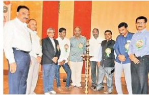
జ్యోతి వెలిగిస్తున్న ఉపకులపతి, అధికారులు

కేయా క్యాంపస్, న్యూఢిల్లీ: దివ్యాంగులు ఆత్మవిశ్వాసంతో అన్ని రంగాల్లో ముందుకు వెళ్లాలని కాకతీయ విశ్వవిద్యాలయం ఉపకులపతి ఆచార్య ఆర్.సాయన్న ఉద్ఘోషించారు. తాము ఎవరికి తీసిపోమన ధైర్యాన్ని పెంచుకోవాలని అన్నారు. కేయా దివ్యాంగుల సెల్ ఆధ్వర్యంలో మంగళవారం కేయా సెనెట్ హాల్లో దివ్యాంగుల దినంలో ఉపకులపతి ముఖ్య అతిథిగా పాల్గొని ప్రసంగించారు. జ్యోతి వెలిగించిన తరువాత ఆచార్య సాయన్న మాట్లాడుతూ.. సాధికారత సాధన వైపు అడుగులు వేయాలని చెప్పారు. మేధావులు దివ్యాంగులకు హక్కులు, పథకాలు, అవకాశాల గురించి బైతన్యాన్ని కల్పించాలని వివరించారు. కేయాలో వీరి కోసం ప్రత్యేక తరగతి గదులను నిర్మించనున్నట్లు తెలిపారు. వసతిగృహాల్లో కూడా ప్రత్యేక గదులు నిర్మిస్తున్నట్లు చెప్పారు. స్పృహనాశితలను పెంపొందించుకోవాలన్నారు. వికలాంగులు కేయాలో పరిశోధనలు చేయడం ఆదేశించిన యమన్నారు. పరిశోధనలు పూర్తి చేసుకొని డాక్టరేట్లను పొందిన వారికి అవకాశాలు పుష్కలంగా ఉన్నాయని వీసీ అన్నారు.