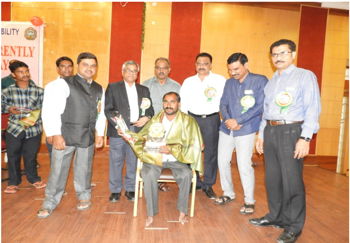
Felicitation to Differently-abled Students who completed Ph.D