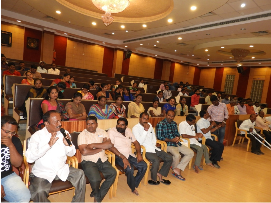
Speech by KU Differently-abled Teacher