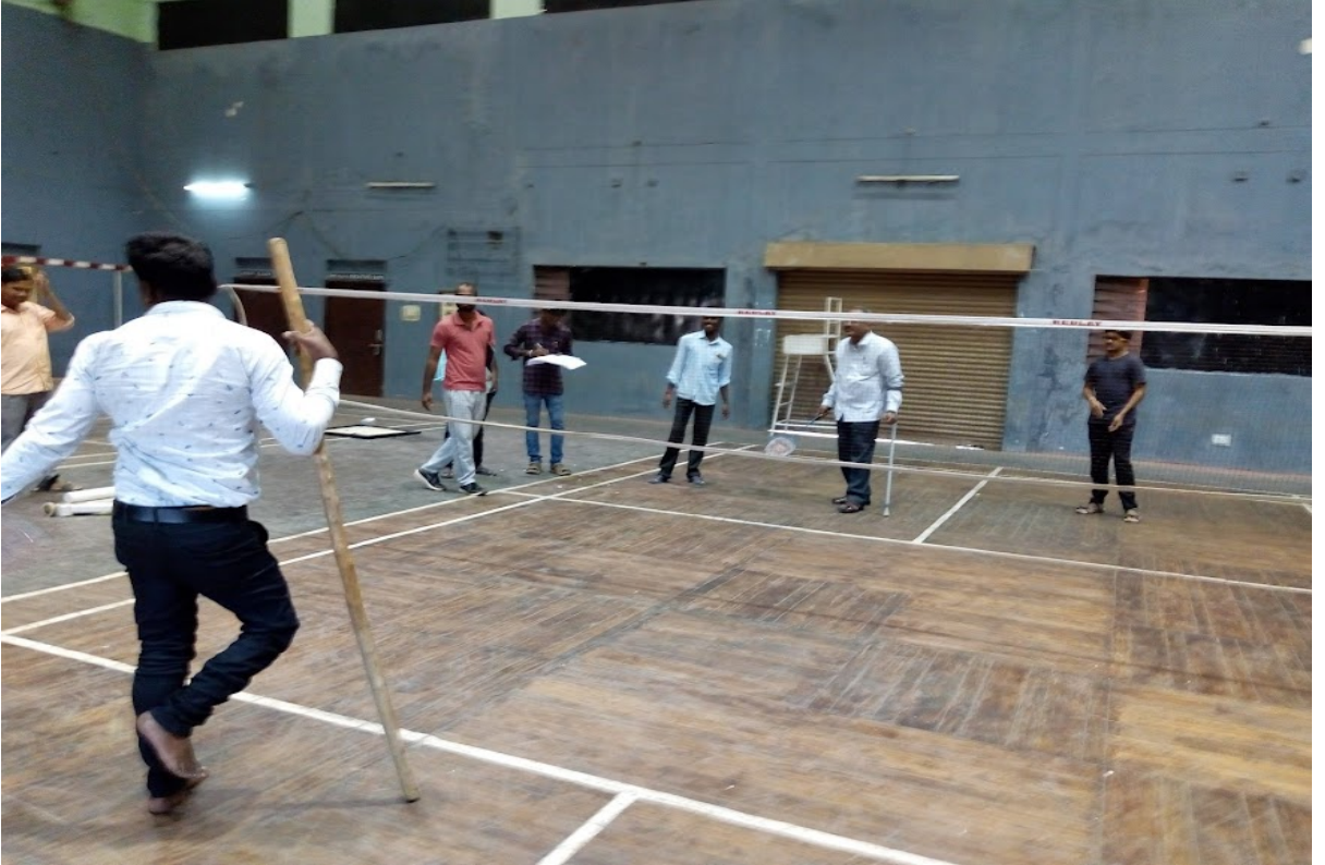
Games For Differently -Abled Students