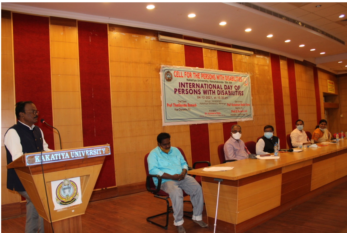
Address by honourable Vice-Chancellor, K.U, Warangal